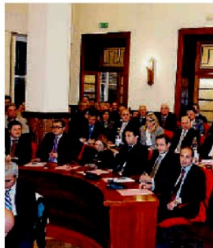
Esponenti della maggioranza

Prima il registro dei tumori, poi il regolamento che razionalizza il sistema dei distributori di carburante. Approvati ieri in seconda convocazione dal consiglio comunale i due punti all'ordine del giorno rimasti in sospeso, a conclusione della prima sessione di lavori di mercoledì. Disco verde, anzitutto all'Odg proposto dal consigliere Lorenzo Lombardo di Forza Italia, finalizzato ad ottenere l'impegno del sindaco e della giunta a riferire entro trenta giorni al massimo sullo stato del registro tumori in ambito cittadino. Una sorta di libro mastro (ne esistono già 43 in Italia corrispondenti al 47% della popolazione) da estendere con il coinvolgimento del palazzo ex Enel «a tutti i comuni della provincia – ha spiegato il consigliere azzurro – allo scopo di imbastire un'azione condivisa, che consenta di procedere in sinergia tra gli enti». L'operazione, peraltro, non sarebbe più rinviabile dal momento che la Regione ha intrapreso l'iter per l'istituzione del registro tumori, (delibera n.289 del 25 marzo 2010), con l'intento di arrivare a distinguere le forme di cancro per tipologia e fasce di età. Nel manuale andrebbe-