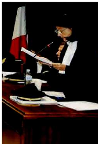
Il procuratore Cristina Astraldi De Zorzi

re un risparmio di 134 milioni e la riorganizzazione del Sistema sanitario regionale, cui è seguito un miglioramento dei livelli di assistenza». In materia di sanità, nel 2013 sono stati 12 gli atti di citazione con una richiesta danni di quasi 14 milioni. Complessivamente gli importi di condanna disposti con sentenza nel 2013 sono ammontanti a quasi 35 milioni di euro. Le condanne totali hanno raggiunto circa il 46% dell'importo richiesto dal pm contabile. Passando ad illustrare l'attività di indagine, Cristina Astraldi De Zorzi ha citato i risultati ottenuti dai cinque comandi provinciali della Guardia di finanza. I finanzieri di Catanzaro hanno accertato danni erariali per quasi 21 milioni segnalando 65 presunti responsabili. Il settore maggiormente indagato è stato quello della sanità ed ha riguardato, in particolare, l'assenteismo dei medici e gli illegittimi