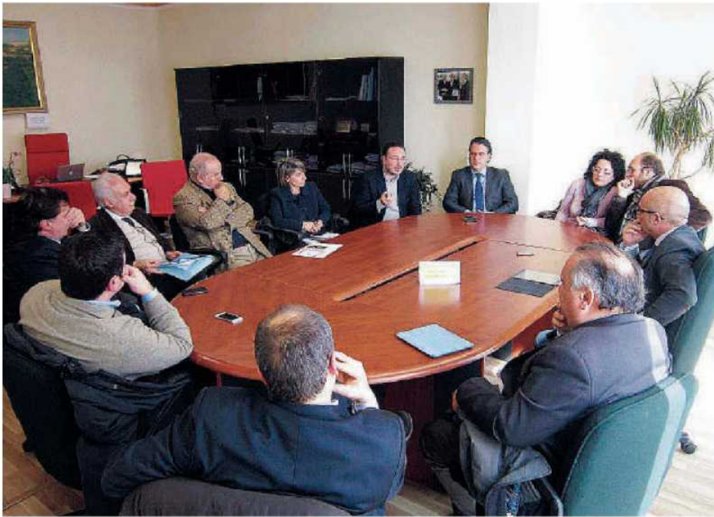
I sindaci del Reventino all'incontro di ieri con il direttore generale dell'Asp Gerardo Mancuso