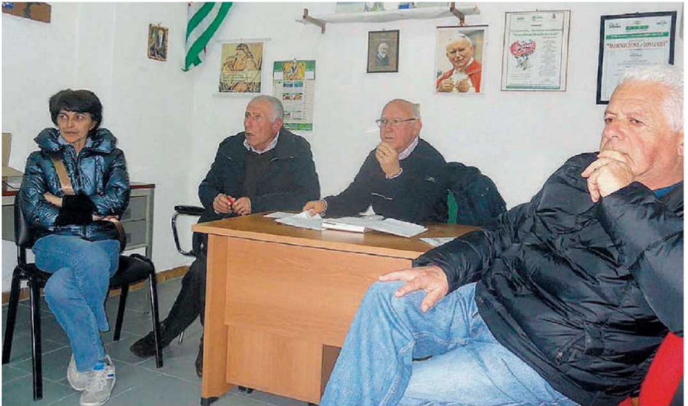
La conferenza stampa dei dirigenti delle confederazioni sindacali dei pensionati nella sede della Lega Fnp-Cisl