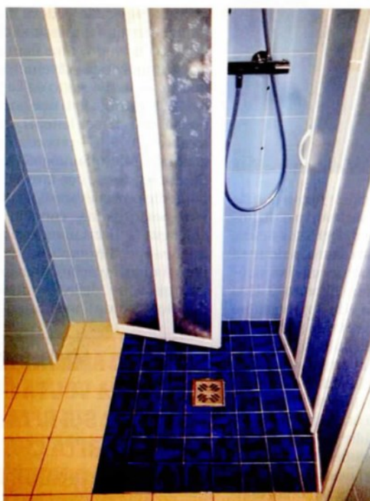
In queste foto, alcuni arredi presenti nei bagni degli Ospedali Riuniti di Reggio Calabria. I prezzi di alcuni accessori hanno raggiunto cifre molto elevate