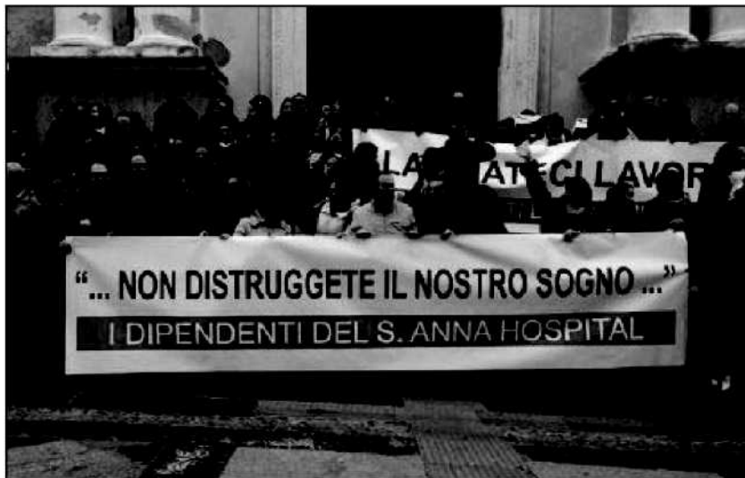
Una delle proteste dei dipendenti del "Sant'Anna"