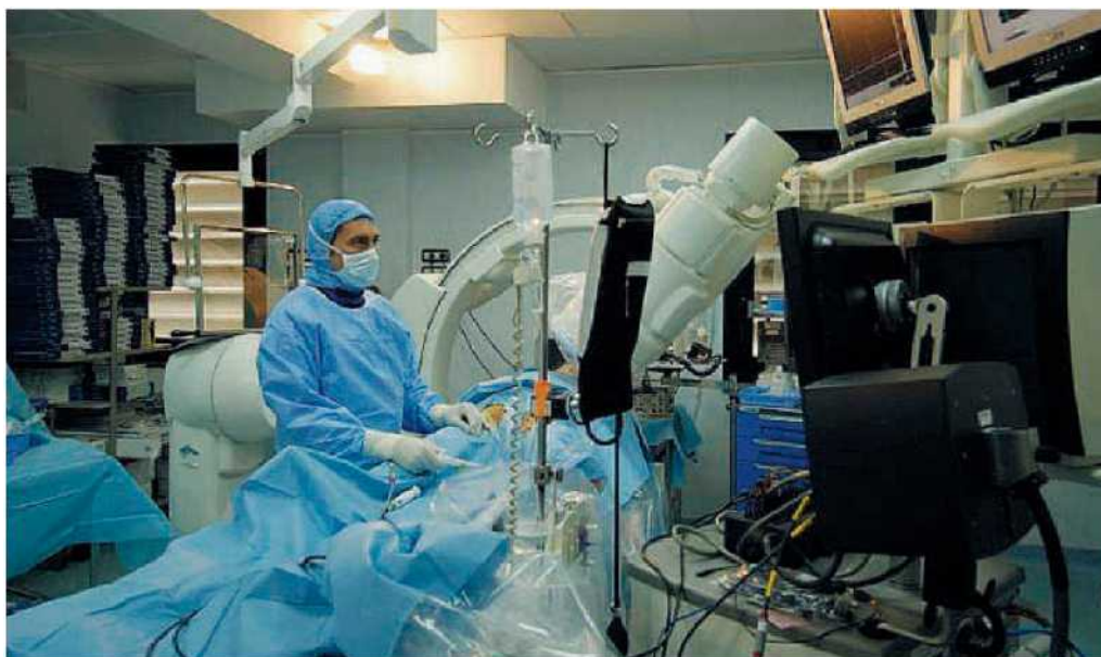
La clinica opera in convenzione nell'ambito del sistema sanitario regionale