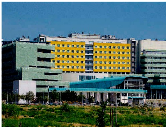
La sede della Fondazione Campanella, nel campus di Germaneto