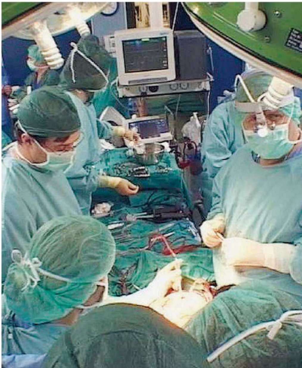
La sanità salva vite ma costa troppo. Una equipe di medici al lavoro in un'immagine di archivio