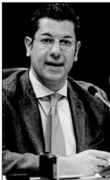
Il presidente della Regione Giuseppe Scopelliti e una sala dialisi

evidenziare che mentre in Calabria il rapporto tra dializzati e popolazione è 1/1479 (anno 2010) nel Vibonese è 1/971 (dati recenti) con aggravio per le casse della sanità vibonese di 3 milioni l'anno. Questo dovrebbe allarmarla. Per questo chiediamo una conferenza dei servizi. Perché signor presidente, ad un anno dall'approvazione del Dpgr 170, i responsabili boicottano il varo di tale decreto che da solo consentirebbe di risparmiare e soprattutto gestire ottimamente dal centro i dializzati? Con l'applicazione di tale decreto - conclude il presidente Aned - vi è la certezza di uniformità di cura e migliore distribuzione dei centri dialisi sul territorio come riportato nell'allegato 5 del richiamato decreto, frutto della collaborazione con la nostra associazione. Per l'importanza delle segnalazioni fatte, sono convinto che stavolta ci darà un riscontro».