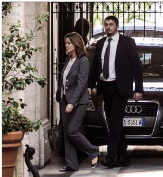
Il ministro della Salute Lorenzin esce da Palazzo Grazioli